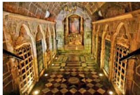
כנסיית הבטורה האורתודוקסית